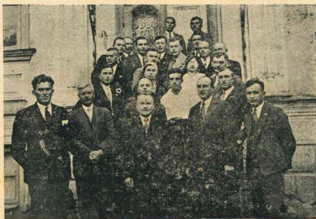
Sdružení českých učitelů v Polsku.

někjak obhajovati tuto politiku ukvapených, neuvážených a neprozřetelných, nepřátelských projevů v polském tisku proti všemu českému a berou na svá bedra velikou odpovědnost za bezpečnost i nám drahého polského státu, který bude muset v budoucnu bojovati o svoji samostatnost s německou rozpínavostí a bude v tomto