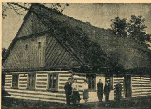
Jedna ze starých chaloupek Kvasilova, dnes už rozbořená.

S osmou hodinou ranní vjíždíme autem do malebné vesničky, rozložené uprostřed rovných, žirných polí.