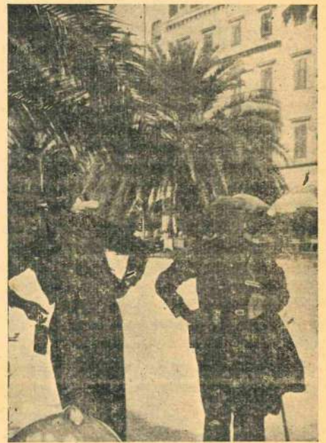
Na ulicích Splitu jsou palmové aleje...

První domy jsou dole u vody, další výš a výše. Celkový pohled — jako schody na ú-