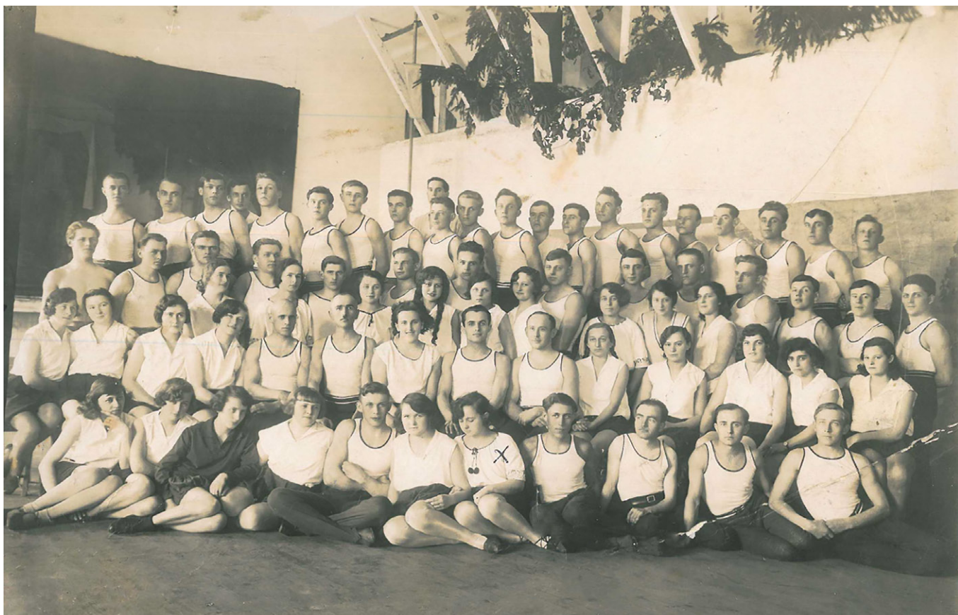
Obr. 8. Účastníci cvičitelského kurzu sokolstva na Volyni

Ve většině jednot se cvičilo zpravidla dvakrát či třikrát týdně. Škála dalších sportovních činností byla v obcích pestrá, v rámci Sokola v Kvasilově či Mirohošti působil například lyžařský odbor, 119 ve Volkově kromě něj kupříkladu i bruslařský kroužek. 120 Na akce do vzdálenějších vesnic se čeští sokolové přepravovali vlaky, žebřinovými vozy a například jednota z Rovna i automobilem. 121 Velkou událostí byly okrskové „slety“ jednot volyňských Čechů, které se každoročně konaly mezi lety 1933–1937 na konci jara či začátku léta. První z nich se uskutečnily ve dnech 8. a 9. července 1933 v Mirohošti. Tyto velké závody vypsal náčelnictvo župy zahraniční ČOS. 122 Na organizaci akce se podílelo také Ústředí Selských jízd v Praze, volyňským jednotám věnovalo putovní cenu mužů (stříbrný pohár). Na závody přijeli i zástupci této organizace, její místopředseda a poslanec československého Národního shromáždění Pavol Teplanský, který tam pronesl projev. 123 Putovní cenu určenou pro vítězné družstvo žen, tj. stříbrnou ratolest na podstavci, věnoval k závodům český poslanec v polském sejmu V. Meduna. 124