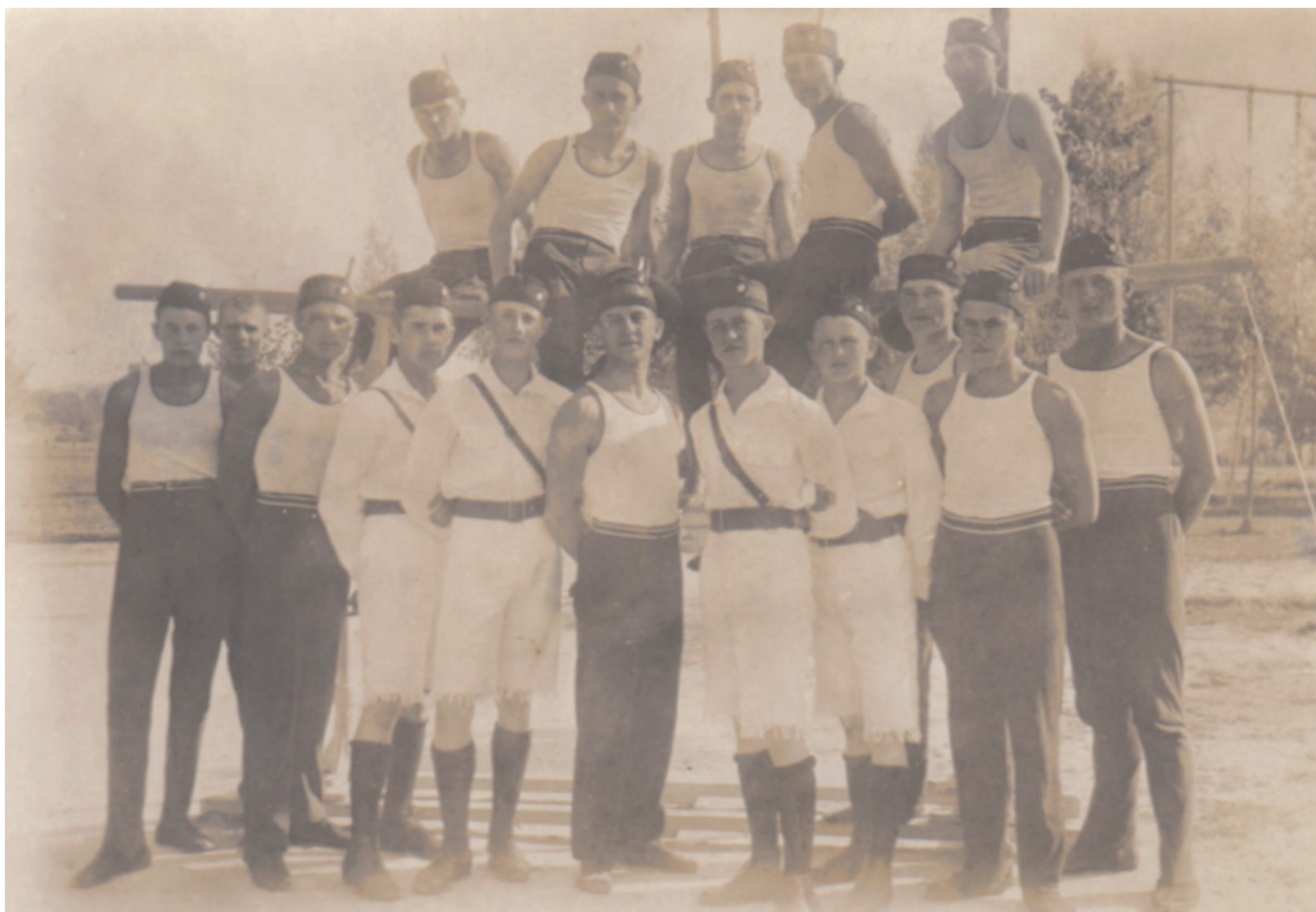
Obr. 4. Fotografie členů obnoveného Sokola v Mirohošti okolo roku 1931, Sběrka Národního muzea

poskytl např. zlínský podnikatel Baťa. Během desetidenního zájezdu navštívila výprava všechny tou dobou fungující jednoty (Kvasilov, Zdolbunov, Mirohošť, Rovno) a účastnila se zde sokolských akademií i veřejných cvičení. 83