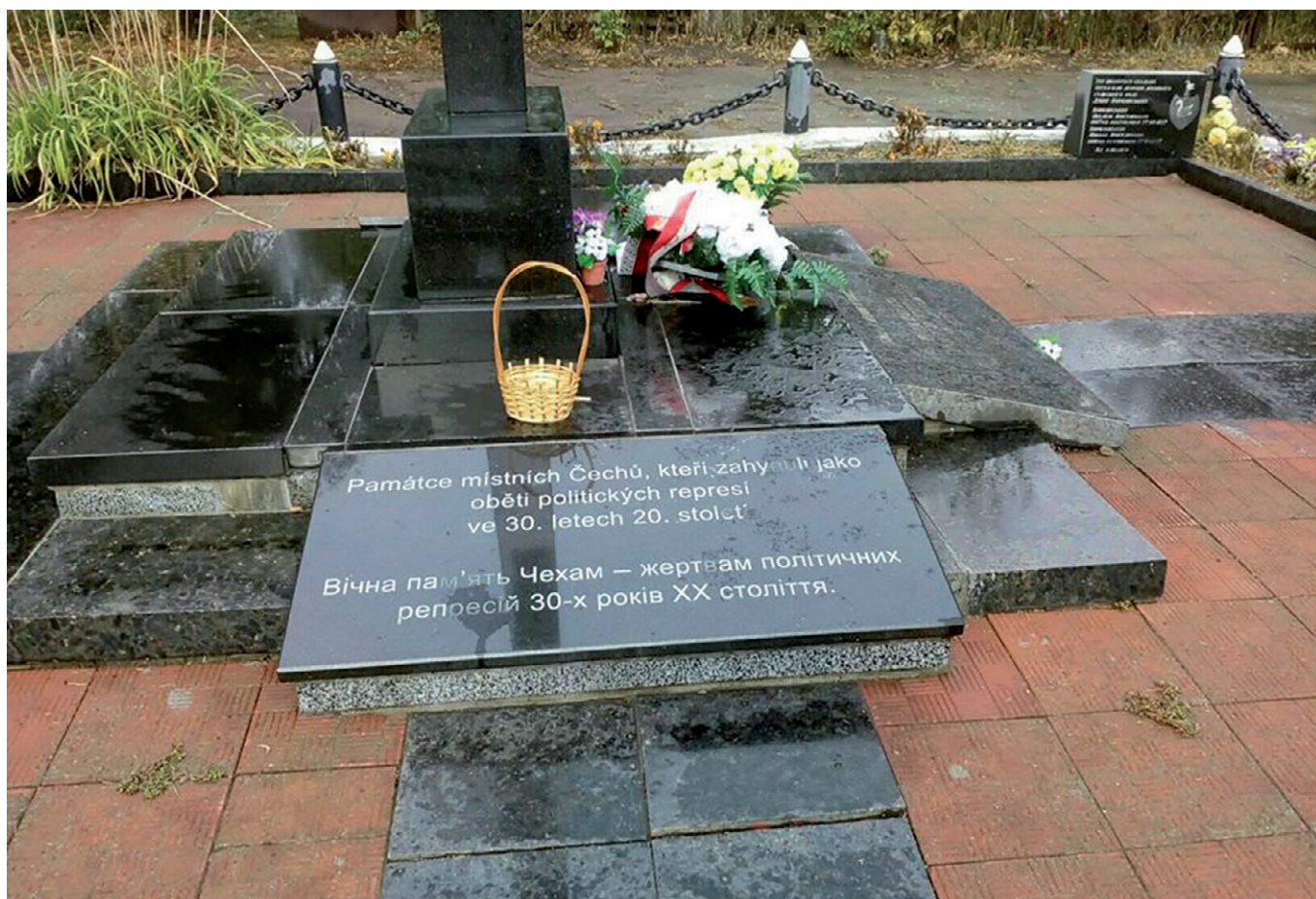
Obr. 12. Památník obětí politických perzekucí v místě jejich poprav v Žitomíru

činnovníci českých Sokolů zatčeni. Část z nich byla odeslána na Sibiř, 159 další údajní spiklenci byli po velkém procesu dne 28. září 1938 zastřeleni, mezi 78 Čechy i řada sokolů, včetně prvního cvičitele Sokola v Krošně České Štefana Tomana. 160