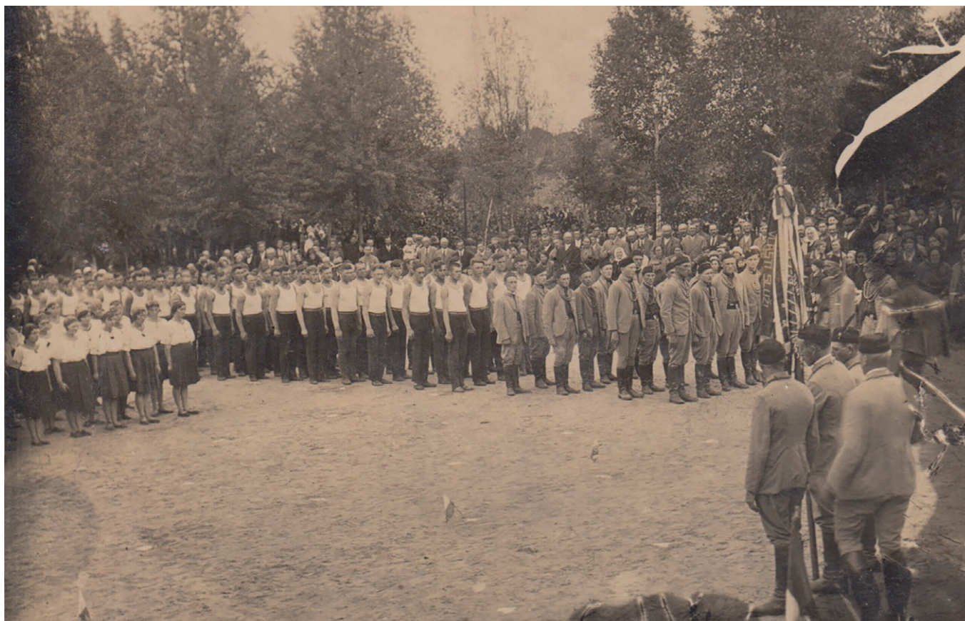
Obr. 9. První velké závody českých jednot v Mirohošti, Sběrka Národního muzea

Poslední závody již v období pozvolného úpadku českých sokolských jednot a za účasti pouze jednoho družstva žen se uskutečnily 20. 6. 1937 v Moldavě. 130 Následující závody se měly konat 12. června 1938 v Mirohošti, ale kvůli neobdrženému povolení z úřadu se nakonec neuskutečnily. 131