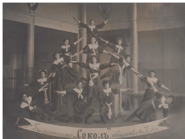
Obr. 1. Figurální cvičení žen gymnastického spolku Sokol v Kyjevě kolem roku 1911