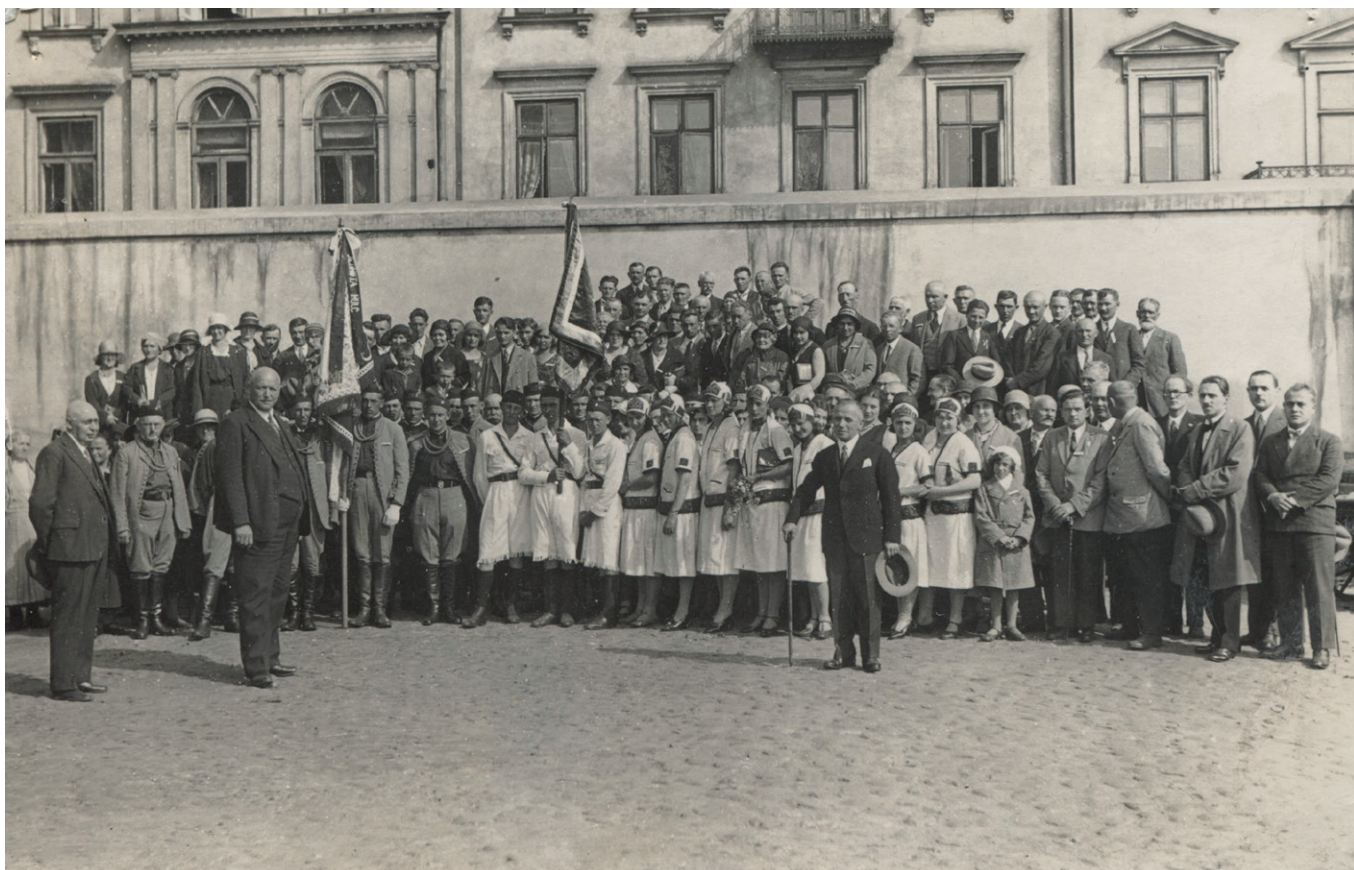
Obr. 10. Češi z Volyně při účasti na všesokolském sletu v roce 1932 v Praze

Tělovýchovná organizace Sokol se neomezovala jen na sportovní činnost, ale ve většině obcí měla především kulturní přesah. Příkladem rozsahu činnosti je působení sokolské jednoty v Straklově. Ta se soustředila i na pořádání divadelních představení (založila si specializovaný divadelní odbor), sokolských akademií, přednášek či různých večírků, například kabaretních s bohatým programem (cvičení, recitace, zpěv). Díky knihám obdržným z Československa si založila i sokolskou knihovnu. 138 V dalších obcích byla škála činností obdobná, v Kvasilově i dalších obcích působila v rámci jednoty také kapela. V mnoha ohledech se činnost spolků v obcích prolínala, v určitých případech to mohlo vést i ke sporům viz Kronika Kvasilova : „Dosti dlouhou dobu hasiči hleděli na Sokola nepřívětivě, vidouce v něm jakousi nežádoucí konkurenci, ale nyní pracují svorně“. 139 Po většinu času ale Sokol s hasičskými sbory i s jinými spolky, např. s Českou maticí školskou, úspěšně spolupracoval. 140 Ustavujícího sjezdu Svazu československých spolků v Polsku se sídlem ve Varšavě, který měl zřejmě dále prohlubovat spolupráci mezi organizacemi, se v roce 1931 zúčastnili zástupci minimálně pěti českých sokolských jednot z Rovna, Hulče, Zdolbunova, Kvasilova a Mirohoště. 141 Význam mělo i personální propojení v rámci různých spolků.