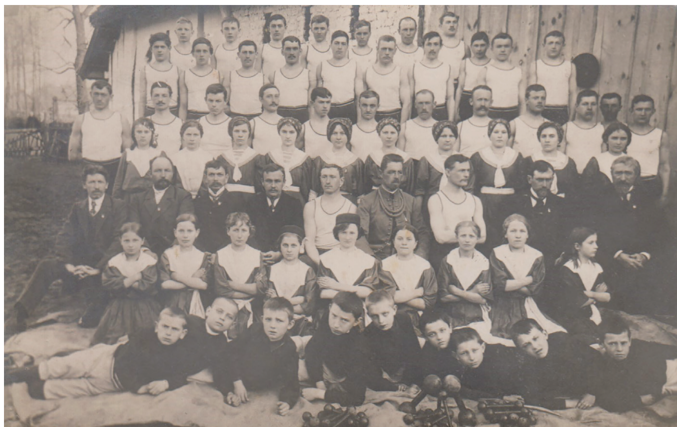
Obr. 3. Skupinová památeční fotografie části sokolů z Kvasilova z roku 1923

později se na Volyň vrátil a vykonával činnost sokolského okrskového vzdělavatele. 75