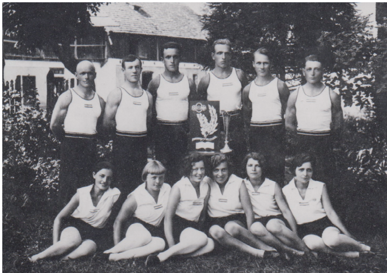
Obr. 13. Součástí sbírek Národního muzea jsou putovní ceny vítězných družstev mužů a žen z této fotografie.

se stal náčelníkem pražské župy Scheinerovy a v roce 1941 dokonce načas hlavou sokolského odboje v protektorátu, 165 což vedlo k jeho zatčení a deportaci do Osvětimi, kde v následujícím roce zemřel.