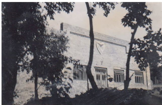
Obř. 7. Budova kvasilovské sokolovny za stromy

Mirohořtě po opětovném založení jednoty a slavnostně ji otevřeli v rámci závodů v roce 1933. „ Majetní bratři dali ze svých nemovitostí kámen, písek, dřevo, povozy, vápno a všichni pak radostně stavěli “. 102 Sokolovna měla rozměry 22x16 metrů (kromě dvou velkých ochozů), jeviště 10x9 metrů a byla vysoká sedm metrů. 103 V Kvasilově se dlouho cvičilo v létě ve venkovních prostorech a v zimě ve zděném, klenutém a vymalovaném chlěvě, který byl však tmavý a pro jednotu neměl dostatečnou kapacitu. Navíc byl načas tento prostor zabrán vojenskou jednotkou (pohraniční stráží), což negativně působilo na chod sokolské jednoty. 104 Dlouhodobá nutnost postavit v obci novou sokolovnu, která se stala střediskem kulturního života v obci, byla naplněna až ve 30. letech. Nářadí používané v Kvasilově ke cvičení již před první světovou válkou bylo používáno i v období meziválečném. 105