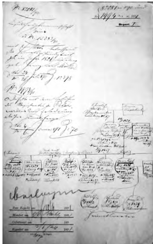
Žádost o vystěhovačský pas z fondu České místo- držitelství, Praha.